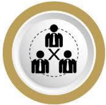
Conflicto de Intereses

En el Capítulo XII del Manual de Buen Gobierno Corporativo, aprobado en la reunión de la Junta Directiva del 15 de marzo de 2022, se estableció que en eventos de conflicto de interés, la Sociedad debe solicitar al menos a dos (2) Compañías Comparables distintas que presten los servicios que se van a contratar para que presenten la correspondiente propuesta de servicios. Cualquiera de los miembros de la Junta Directiva designado por uno de los Accionistas distinto del que está interesado en prestar los servicios tendrá derecho a designar al menos otras dos (2) empresas que sean Compañías comparables para que se pida oferta a las mismas. Una vez recibidas las propuestas se presentarán, junto con la del Accionista Interesado, a la Junta directiva para que ésta las evalúe. La Junta Directiva decidirá, con base en los criterios del mercado correspondiente, cuál de las propuestas de servicios se aceptará y en qué condiciones.